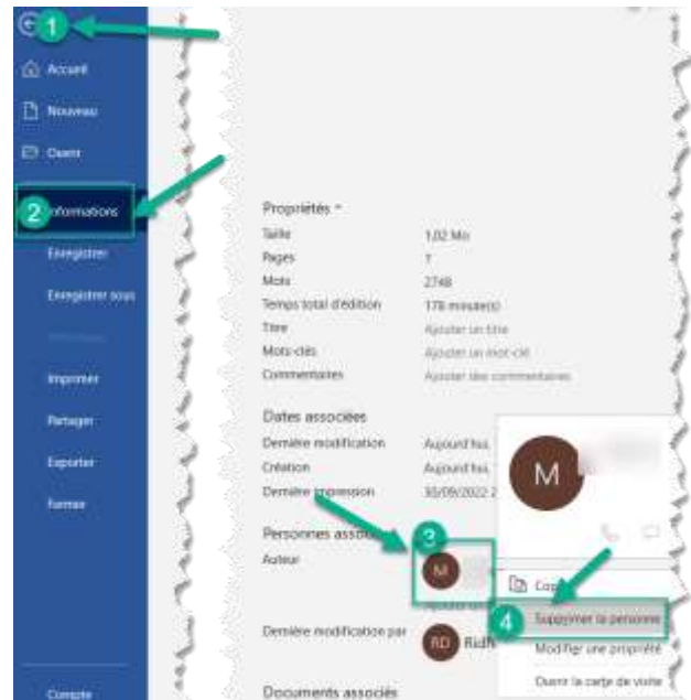
Figure 5: Supprimer les métadonnées des fichiers Word

Ces mesures contribueront à garantir l'anonymat lors de l'évaluation en double aveugle. Cependant, il est crucial de ne pas oublier de soumettre une page de garde avec l'article. Cette « page de garde » joue un rôle crucial dans le processus d'évaluation en double aveugle. Bien qu'elle ne soit pas partagée avec les rapporteurs, elle fournit aux éditeurs en chef des informations essentielles sur l'article, telles que le titre, le résumé et les mots-clés, ainsi que sur les auteurs, notamment la liste des auteurs, leurs affiliations et leurs coordonnées. Ces informations permettent aux éditeurs en chef de mieux décider de la suite à donner à la soumission et de vérifier l'absence de conflit d'intérêts avec les rapporteurs, garantissant ainsi une évaluation équitable et impartiale de la soumission.