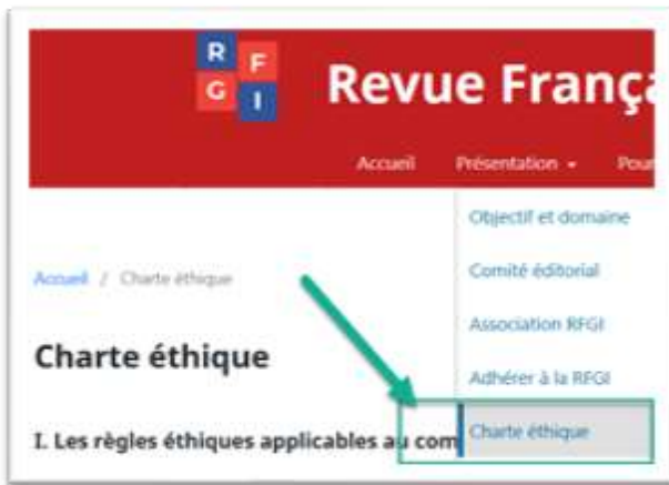
Figure 2: Charte éthique, Source : https://rfgi.fr/rfgi/about/ethicCode

le 1.2 de la charte décrit le processus d'évaluation et spécifie que les articles soumis à la revue sont évalués selon le principe du double aveugle . Dans ce processus, ni les auteurs ni les rapporteurs ne connaissent l'identité de l'autre. Cette approche vise à prévenir tout potentiel biais dans l'évaluation et garantit que les soumissions sont évaluées uniquement sur la base de leur contenu (Derrouiche, R., & Fernandes, V., 2021).