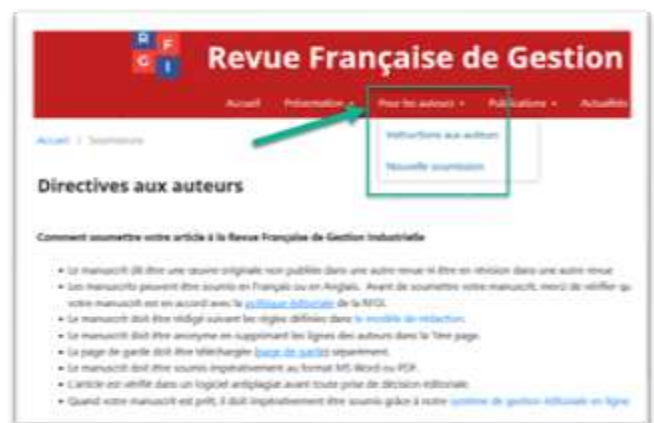
Figure 4: Instruction aux auteurs