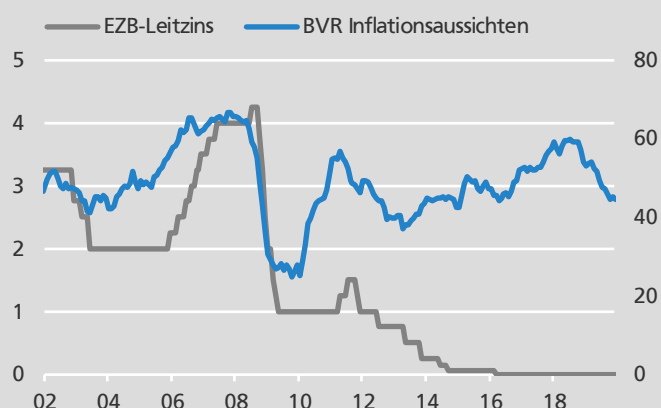
BVR Inflationssichten in Punkten, Euroraum

Unser Modell für die BVR Inflationssichten ergibt für März unverändert 44 Punkte. Dies entspricht einer moderaten Teuerung in mittlerer Frist. Allerdings ist zu berücksichtigen, dass unser Modell lediglich verfügbare Daten verarbeitet. Der aktuelle und äußerst kurzfristige Schock durch das Corona-Virus kann mangels Daten noch nicht vollständig abgebildet werden. Die Aussichten sollten in den kommenden Monaten deutlich sinken. ■